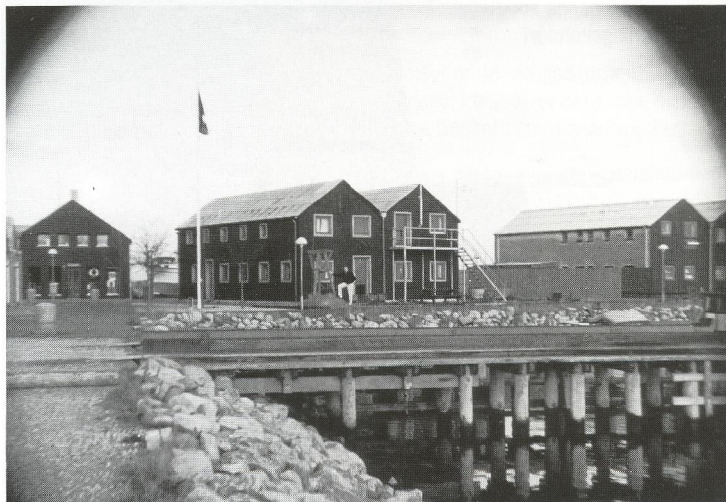
Sådan bliver resultatet, når telekonverteren bruges med zoomen på vidvinkel. Og da søgeren kun viser 83% af billedfeltet, kan miseren ikke ses, før filmen kommer fra fremkaldelse.